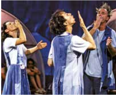
© Gilles Destexhe - Province de Liège