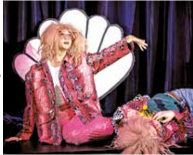
© Kharrin Saïdi - Province de Liège