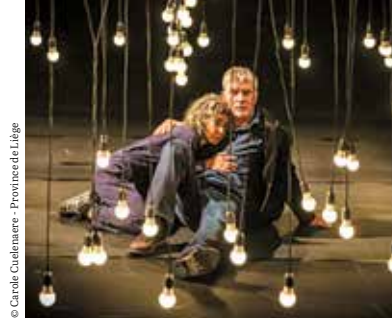
© Caroline Cuddeheer - Province de Liège