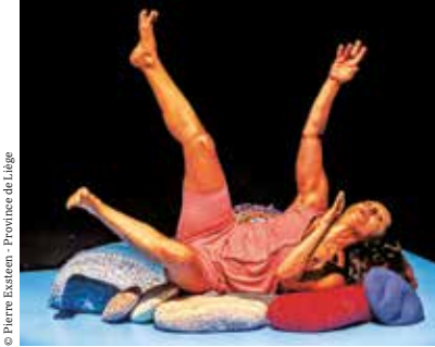
© Pierre Exsteen - Province de Liège