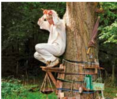
© Pierre Bastien - Province de Liège